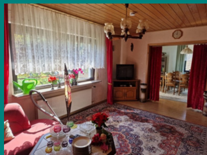
Wohnzimmer mit angrenzendem Esszimmer